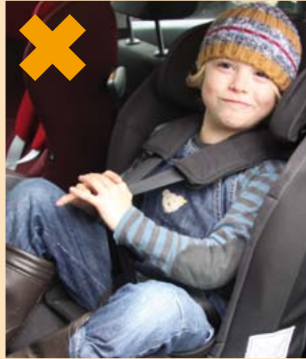
Gefährlicher Gurtverlauf: Gleiche Gurtlänge mit / ohne dick gefütterte Winterjacke